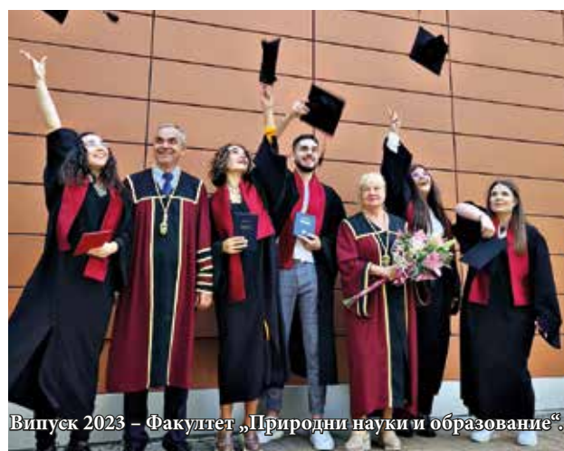
Випуск 2023 – Факултет „Природни науки и образование“.