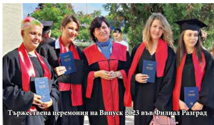
Тържествена церемония на Випуск 2023 във Филиал Разград