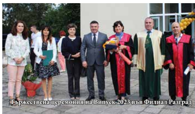
Тържествена церемония на Випуск 2023 във Филиал Разград