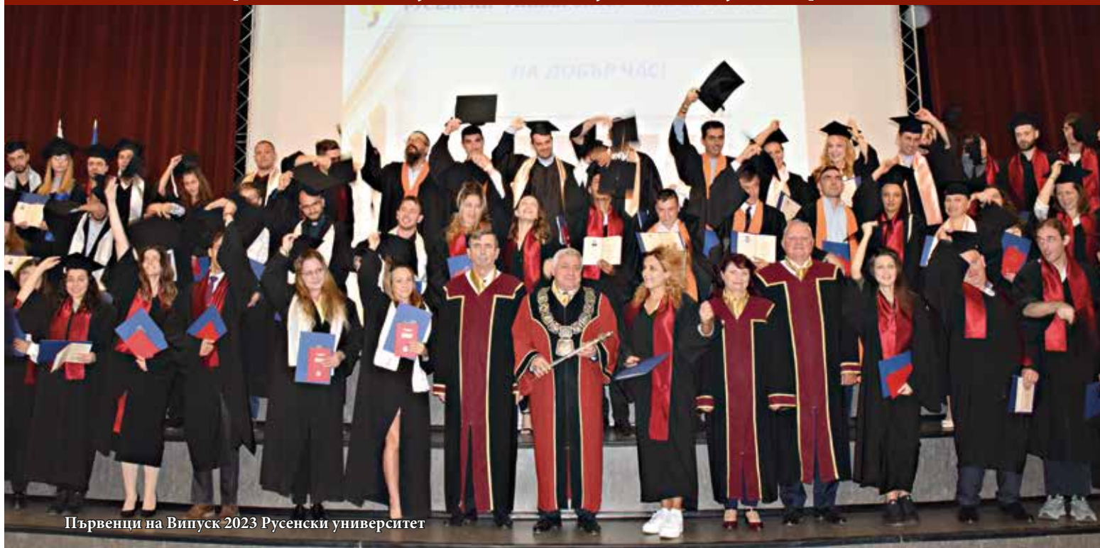
Първенци на Випуск 2023 Русенски университет

На 29 септември 2023 г. в Канев център на Русенския университет се проведе официална церемония „Промоция на випуск 2023“. Общо 1096 абсолвенти получиха дипломите си от русенската Алма матер. Ректорът на университета академик Христо Белолев лично връчи дипломите на 14 пълни отличници и 53 първенци на специалности. Равносметката за академичната 2022–2023 година е 1284 дипломирани абсолвенти.