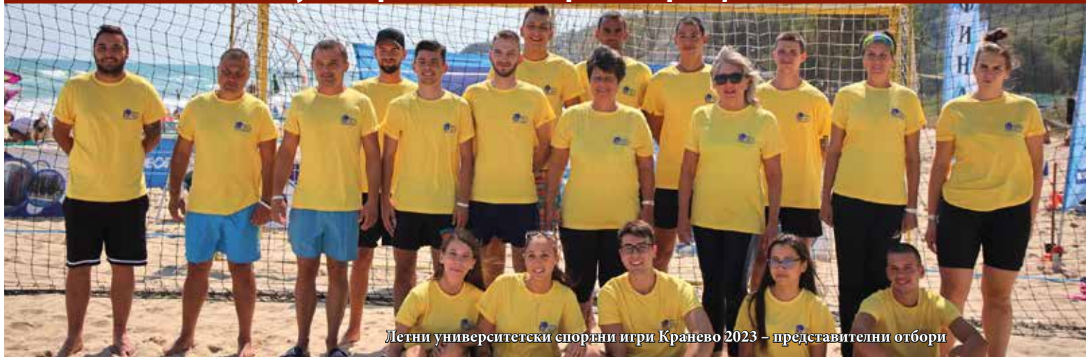
Летни университетски спортни игри Кранево 2023 – представителни отбори