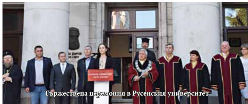
Тържествена церемония в Русенския университет

Днес Русенският университет олицетворява постоянството в стандарта на обучение и наука, присъщ за водещите в Европа висши учебни институции. Давайки на студентите си съвременни теоретични и практически знания и подготвяйки ги за настоящите и бъдещи предизвикателства, той формира бъдещи лидери.