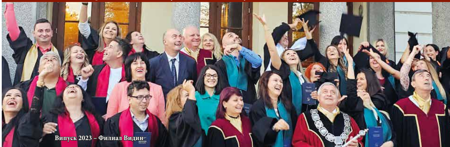
Випуск 2023 – Филиал Видин