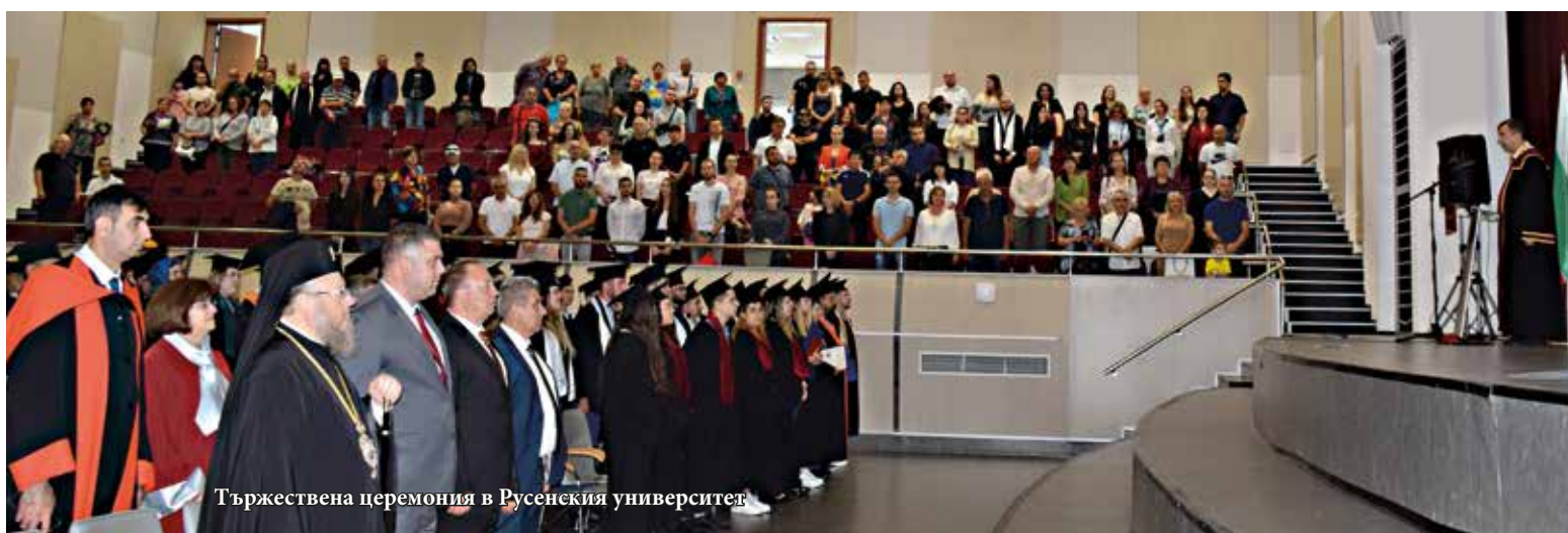
Тържествена церемония в Русенския университет