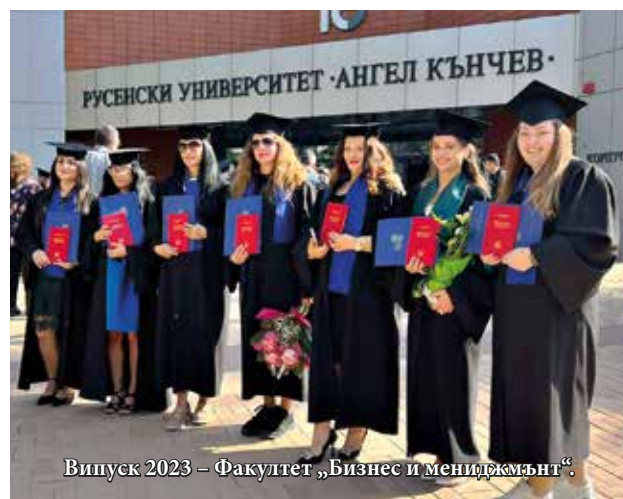
Випуск 2023 – Факултет „Бизнес и мениджмънт“.