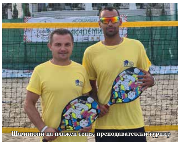
Шампиони на плажен тенис преподавателски турнир