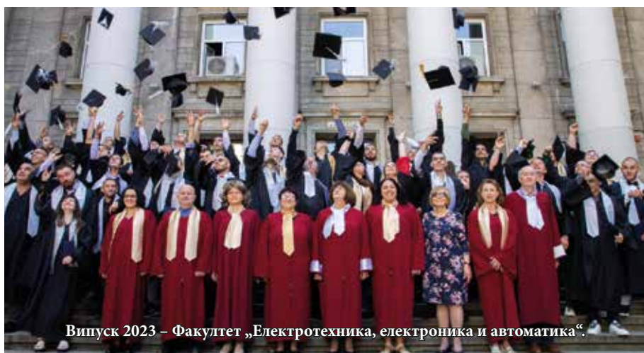
Випуск 2023 – Факултет „Електротехника, електроника и автоматика“.