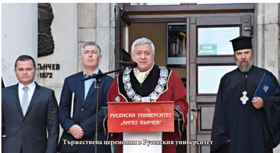
Тържествена церемония в Русенския университет

Той обяви, че с най-висок бал за академичната 2023–2024 г. в Русенския университет са приети общо 51 нови студенти.