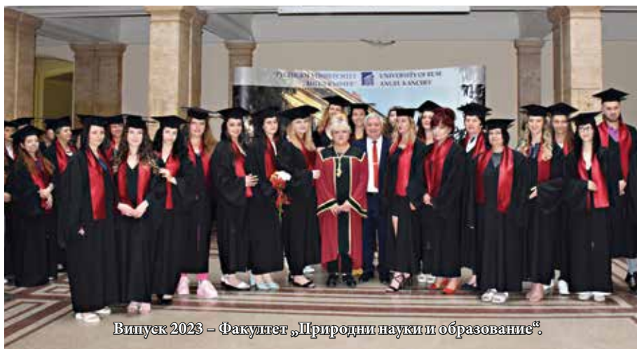
Випуск 2023 – Факултет „Природни науки и образование“.