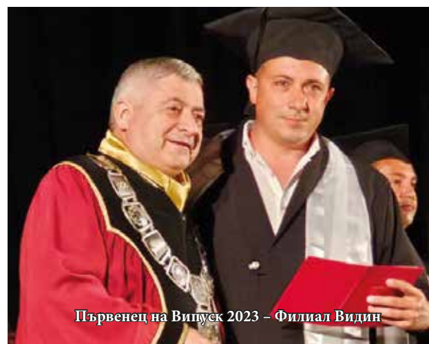
Първенец на Випуск 2023 – Филиал Видин