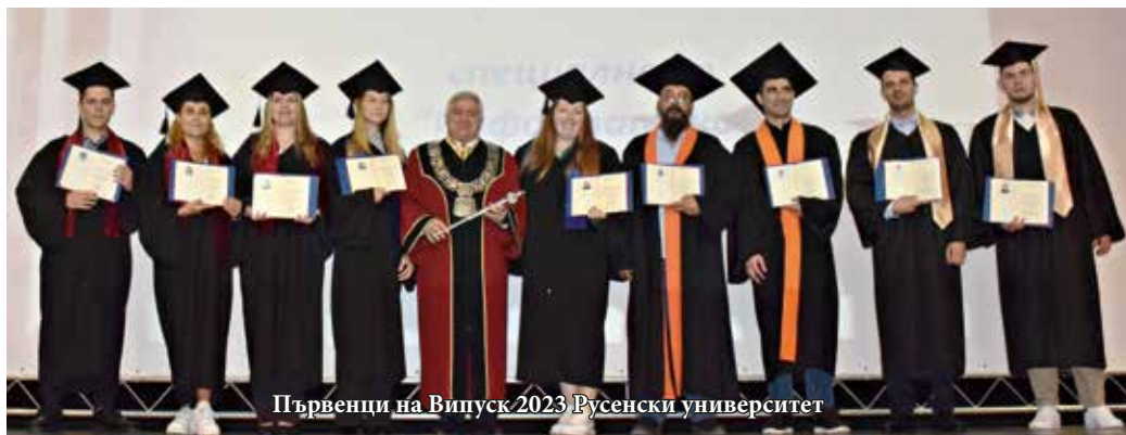
Първенци на Випуск 2023 Русенски университет

След тържествената церемония празникът продължи по факултети.