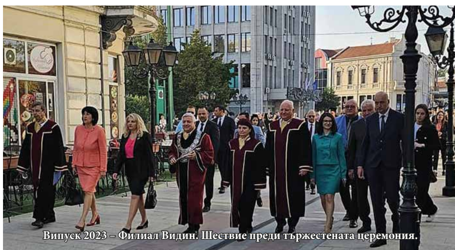
Випуск 2023 – Филиал Видин. Шествие преди тържествената церемония.