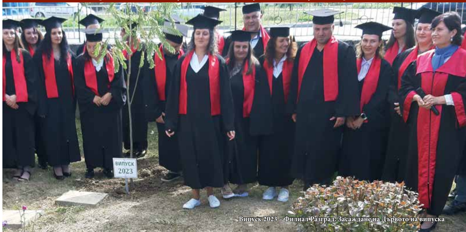
Випуск 2023 – Филиал Разград. Засаждане на Дървото на випуска