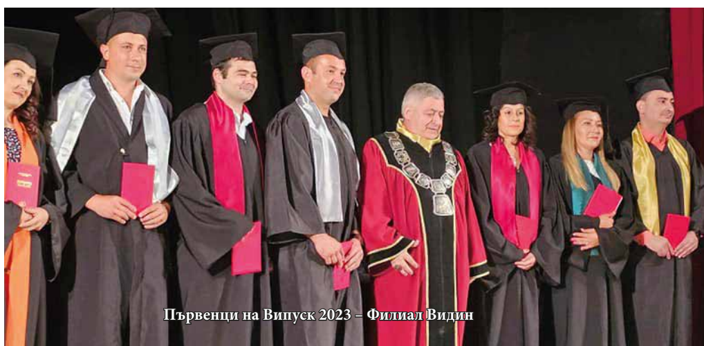
Първенци на Випуск 2023 – Филиал Видин